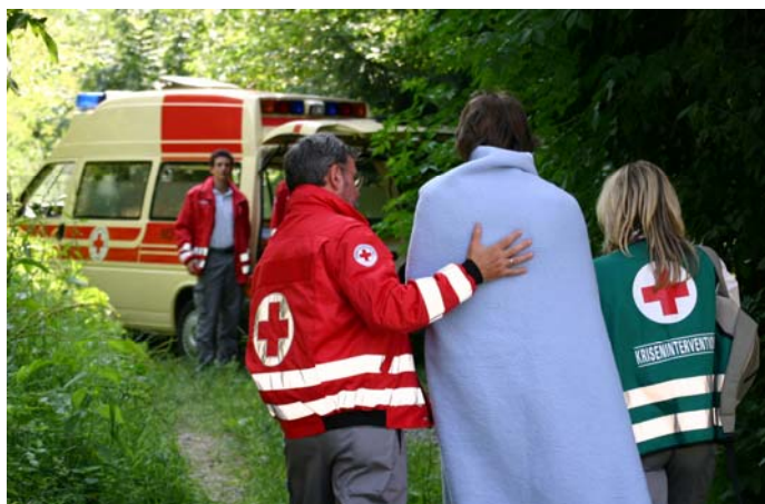
Die Mitarbeiter des Roten Kreuzes bieten Hilfe und Unterstützung in Krisensituationen.

Ausgabe kostenloser, von Osttiroler Händlern zur Verfügung gestellter Lebensmittel an sozial Schwachgestellte; Ausgabestart ist die Rot-Kreuz-Bezirksstelle Osttirol, jeweils samstags um 18.45 Uhr.