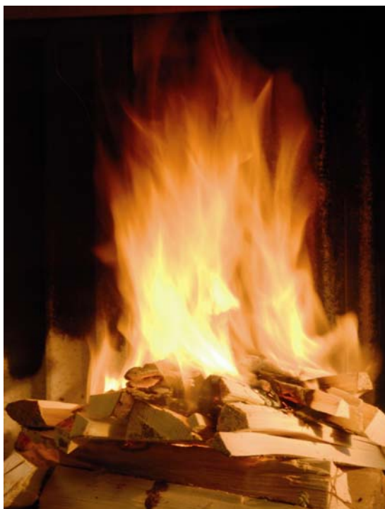
Rasch ein kräftiges Feuer mit hellen Flammen herstellen

Besonders in der kalten Jahreszeit hat Tirol mit schlechten Luftwerten zu kämpfen, kommen doch zu den Belastungen aus dem Verkehr im Winter auch Schadstoffe aus dem Hausbrand und häufige Inversionswetterlagen hinzu. Wie zur Verbesserung der Luftqualität beigetragen und gleichzeitig Geld gespart werden kann, ist jetzt in einem neuen Info-Falter des Landes nachzulesen.